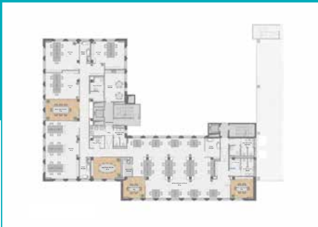
Pianta Tipo Piano 2° e 3° - Layout Uffici