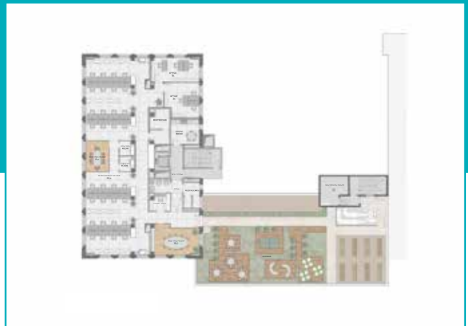
Pianta Piano 4° con Terrazzo - Layout Uffici